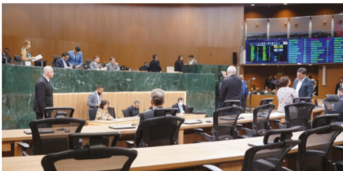
A Ordem do Dia da sessão ordinária da Assembleia Legislativa registra 29 processos aptos à deliberação

Na esteira, os deputados vão analisar, também em segunda fase, a matéria que institui a Se-