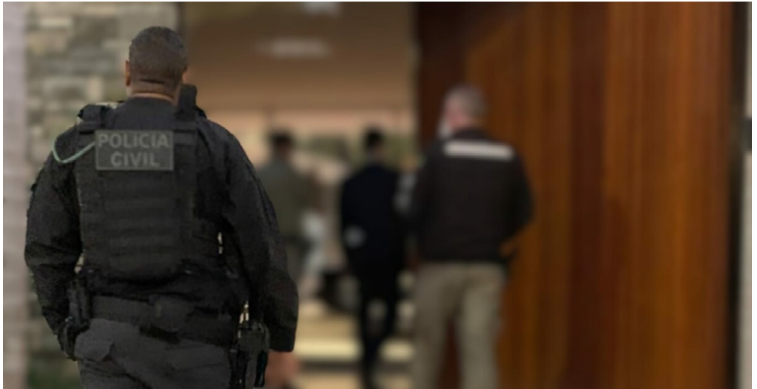
A operação é parte de uma investigação que começou em agosto de 2023

A invasão da propriedade, situada em uma área de pro-