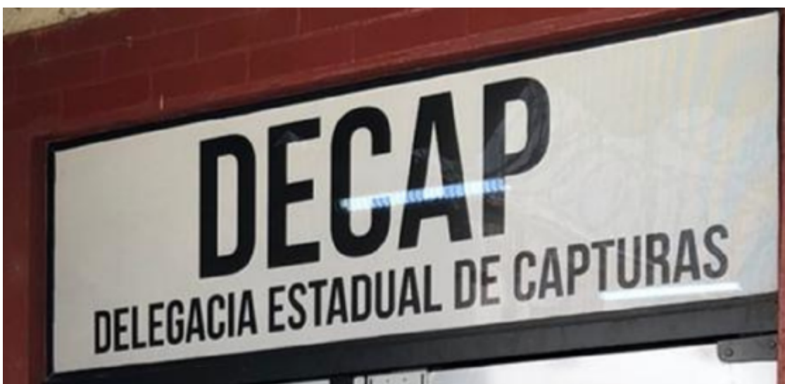
A ação resultou na detenção de indivíduos envolvidos em delitos graves como homicídio e tráfico de drogas

Parque Estrela Dalva IV, os agentes cumpriram um mandado de prisão definitivo contra um homem condenado por tráfico de drogas, de acordo com o artigo 33 da Lei 11.343/06. A sentença, oriunda da 6ª Vara Criminal do