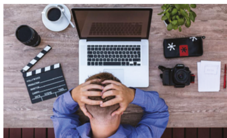
Cerca de 11 milhões de brasileiros são afetados pelo transtorno, conforme dados mais recentes, referentes a 2022