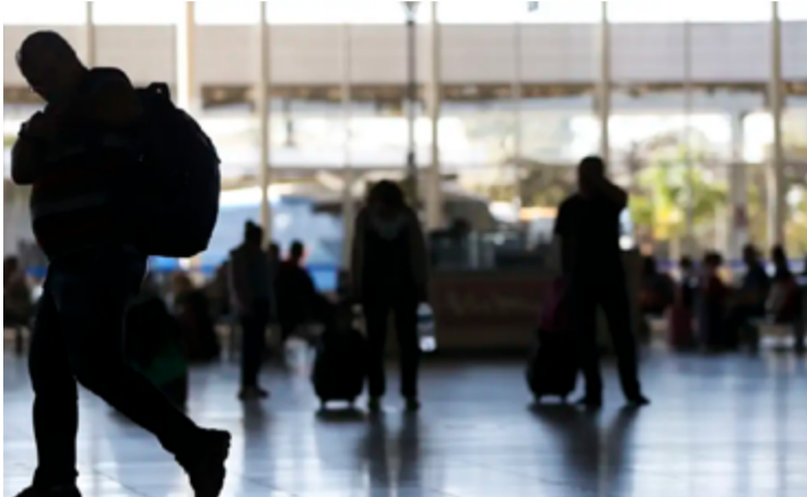
Plano prevê identificar aliciadores e vítimas no ambiente digital

A iniciativa busca ampliar e aperfeiçoar a atuação de órgãos e entidades públicas, além de promover a prevenção, a proteção às vítimas