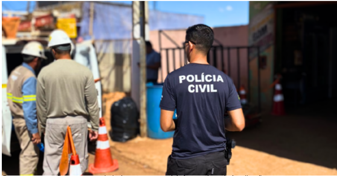
Durante a operação, quatro estabelecimentos comerciais foram alvos de fiscalização

Durante a operação, quatro estabelecimentos comerciais foram alvos de fiscalização. Em três deles, os agentes constataram de imediato a existência de ligações irregulares, configurando a subtração indevida de energia elétrica. A situação mais grave foi identificada em um desses locais, onde o proprietário foi preso em flagrante. No estabelecimento em questão, a energia estava sendo captada diretamente da rede elétrica,