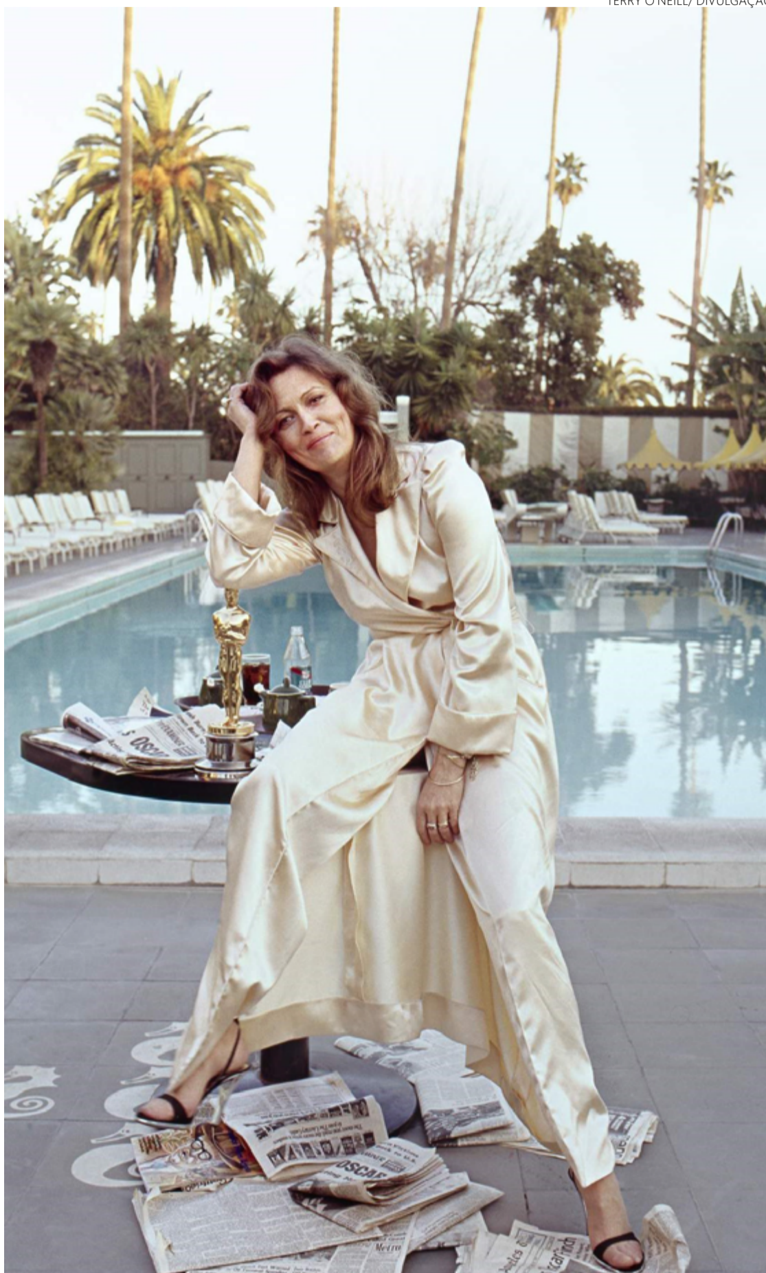
Faye Dunaway diz que acha importante o que feministas fazem

"Há uma excitação, mas também o oposto disso, que é a tristeza. Fiquei muito aliviada ao entender essa questão mental, porque isso explica tudo. Mas, ainda assim, você é responsável pelas suas atitudes, então mesmo que isso possa explicá-las, não necessariamente é uma desculpa", diz a