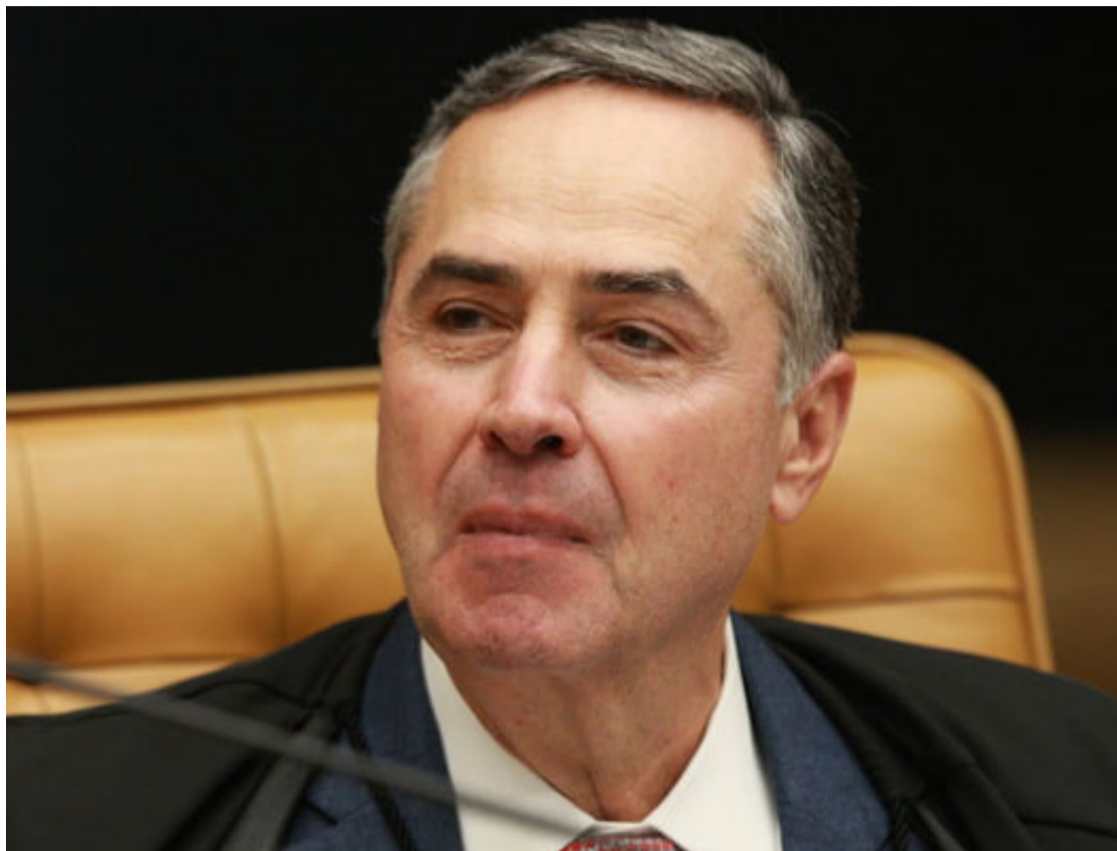
Luis Roberto Barroso: defensor do combate à corrupção

Disse, porém, que nenhuma das decisões foi tomada visando a aprovação popular da corte. Para ele, "a importância de um tribunal não pode ser