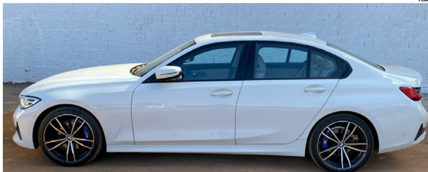
Além da prisão, a operação resultou na apreensão de dois veículos de luxo adquiridos com os recursos obtidos através da fraude: uma BMW 320i e um Hyundai HB20,

A ação policial foi desencadeada quando os sócios da empresa, ao perceberem inconsistências nos pagamentos, acionaram a Polícia Civil. Os