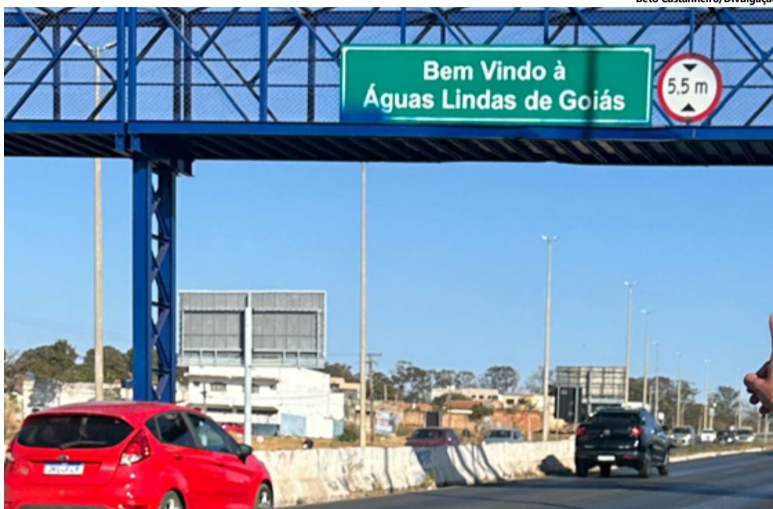
O BRT de Águas Lindas de Goiás pretende atender cerca de 50 mil pessoas, oferecendo um sistema de transporte coletivo rápido, eficiente e de alta capacidade