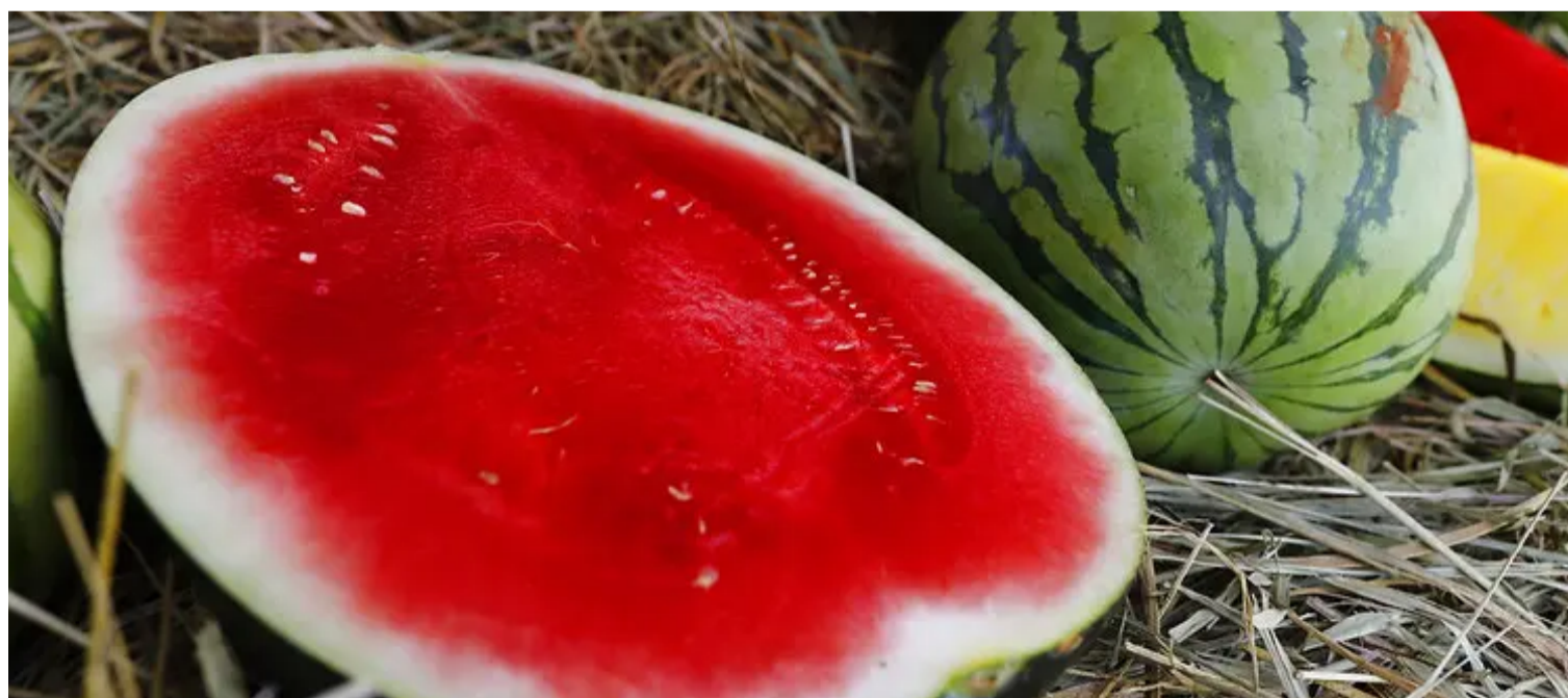
A medida visa ao monitoramento da praga Anastrepha grandis (espécie de mosca-das-frutas)

Atualmente, o cadastro das Unidades de Produção é exigido para 17 municípios goianos, onde produtores manifestaram à Agrodefesa o interesse em exportar os frutos, atendendo à obrigatoriedade do cadastro das UPs no SIDA-GO, e tiveram seus projetos para implantação do Sistema de Mitigação de Riscos (SMR), elaborados pela Gerência de Sanidade Vegetal, aprovado oficialmente pelo Ministério da Agricultura e Pecuária