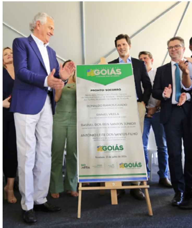
Governador Ronaldo Caiado e Daniel Vilela durante inauguração do novo pronto-socorro do Hetrin

Desde 2019, sete novos hospitais passaram a atender o interior do estado, em Itumbiara, São Luis de Montes Belos, Luziânia, Formosa, Jataí, Uruaçu e Águas Lindas. Em breve, novas estruturas serão entregues em Mozarlândia e Campos Belos.